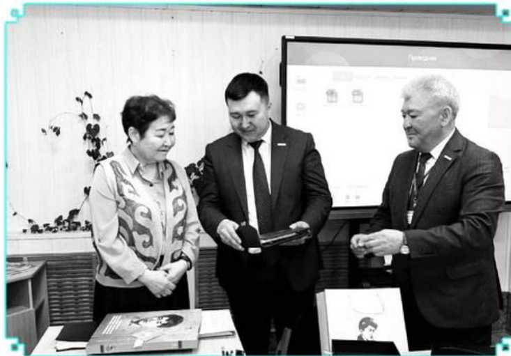
Сәуір айының 3-ші жұлдызында Семейдегі Қазақстан мемлекеттік архивінің ұйымдастыруымен Мағжан Жұмабаев ауданы филиалында «Аудандық филиалдар қызметінің көрсеткіштерін талдау және толықтыру көздерімен жұмыс» тақырыбында облыстық көшпелі семинар-кеңес өтті.