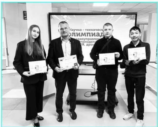
Мағжан Жұмабаев ауданының білім бөлімі.

Жеңімпаз атанған «RedDragon» аудан командасын жарқын жеңісімен құттықтап, заманауи технологиялар саласында алдағы уақытта да табыс пен жаңа жетістіктер тілейміз.