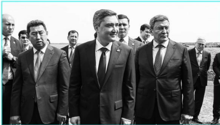
Премьер-министр Олжас Бектенов Солтүстік Қазақстан облысына жұмыс сапары аясында Президенттің агроөнеркәсіп кешенін дамыту, ауыл шаруашылығының өнімділігін арттыру және отандық өнімді терең өңдеу жөніндегі тапсырмаларының орындалу барысын тексерді. Атап айтқанда, «Атамекен-Агро-Корнеевка» ЖШС цифрлық тауарлы сүт фермасы, «Қызылжар Жем» ЖШС шаруашылығы және «Eurasian milk» ЖШС сүт өңдеу зауытына барды.

«Бүгінгі таңда эпизоотиялық жағдай қолайлы болып отыр. Соңғы үш жылда біздің өңірде бруцеллез 12 есе азайды, қойласыз пункттер 7 пунктке төмендеді деген ұйғарым алдық. Аурудың күрт өршу ошағы қысқарды. Бұл үшін барлық жағдайлар жасалған, биыл республикалық