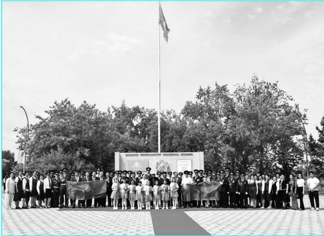
4 маусым күні Бұлаев қаласында орналасқан орталық алаңда Қазақстан Республикасының Мемлекеттік рәміздер күні аталып өтті.

Мемлекеттік рәміздер стелласында өткен салтанатты іс-шараға аудан тұрғындары, мекеме және ұйым өкілдері, сондай-ақ жастар қатысты. Іс-шара аясында Қазақстан Республикасының Мемлекеттік Туын көтеру