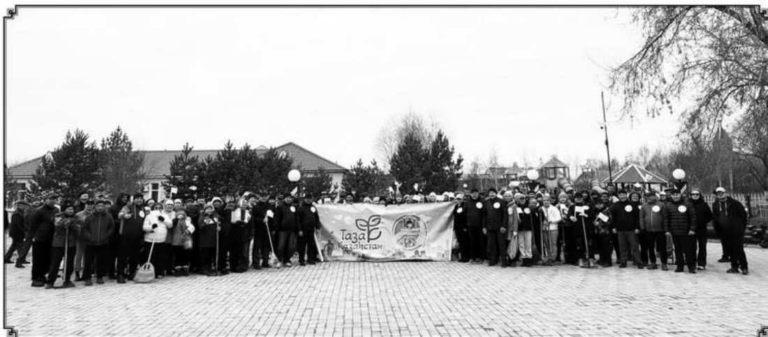
САҢ МЕН ТӨРТП