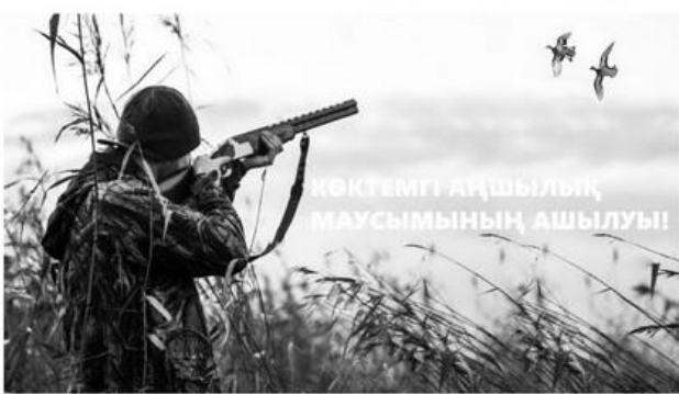
Көктемгі аңшылық маусымының ашылуы!

кезеңінде жұптасады, ал егер еркек ауланса, әйел тез арада басқа серіктес табады. Алайда, көктемде тіпті бір аналықтың өлімі - бұл бүкіл балапандардың тікелей жоғалуы, бұл сөзсіз алқаптардың азаюына әкеледі.