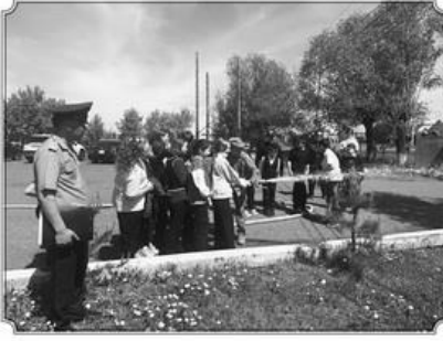
Іс-шара барысында Мағжан Жұмабаев ауданы төтенше жағдайлар бөлімінің қызметкерлері қатысушыларды күнделікті қызметімен, мамандандырылған техникамен,

Аудан прокуратурасының бастамасымен «Заң және тәртіп» идеологиясын ілгерілету ақциясы аясында аудан мектептерінің оқушылары үшін Мағжан Жұмабаев ауданының төтенше жағдайлар бөліміне «Құтқарушының бір күні» атты экскурсиясы ұйымдастырылды.